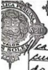
EXHIBIT N° 62983573